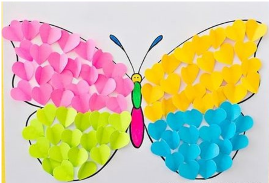
UN COLLAGE DI TANTI COLORI