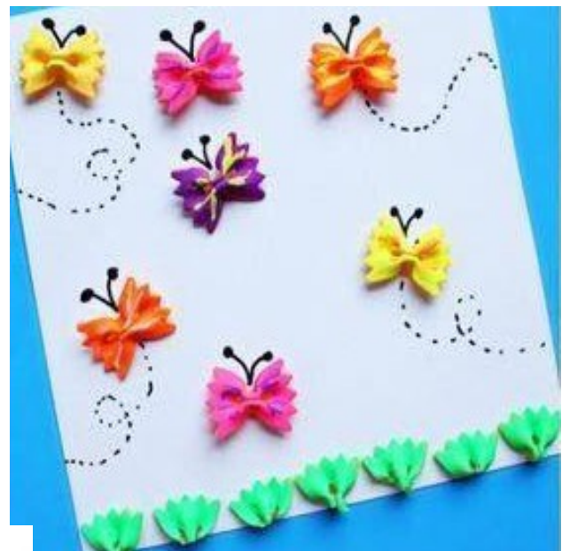
FARFALLE DI PASTA COLORATA