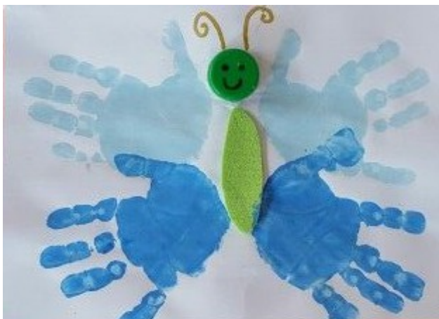
IMPRONTA DELLE MANI

COLORARE SEGUENDO IL DISEGNO DI UN FOGLIO DI CARTA ASSORBENTE