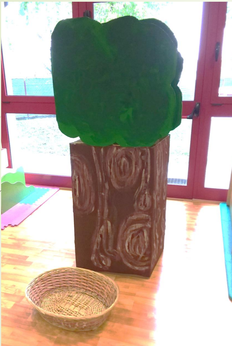
Abbiamo costruito il nostro ALBERO DELLA GENTILEZZA