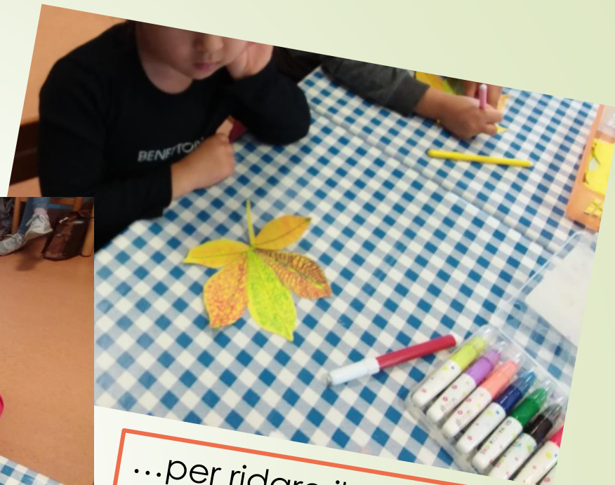
...per ridare il colore e il sorriso all'ALBERO DELLA GENTILEZZA