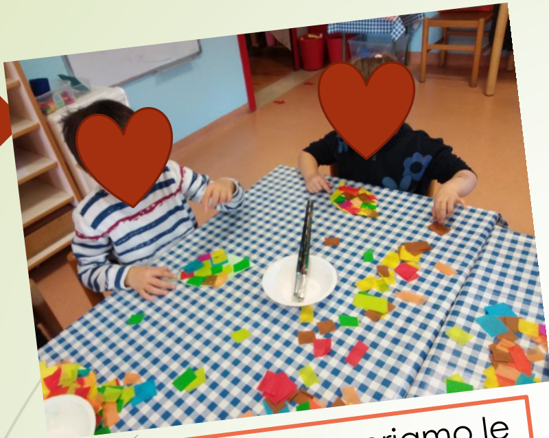
Coloriamo e decoriamo le foglie...