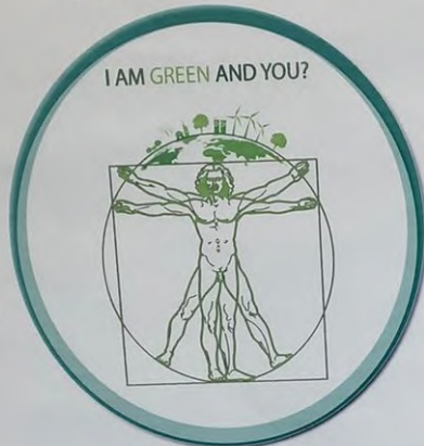
Progetto Grafico "I am green and you?" classe IVH Grafica Liceo Artistico Statale Enzo Rossi - Roma