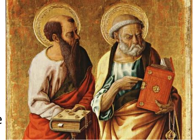
San Pietro e Paolo

Dove abbiamo sentito parlare dei Romani? Ne abbiamo sentito parlare nel libro di Religione Cattolica di 5 a riguardo alle origini della Chiesa Cristiana: Pietro e Saul/Paolo.