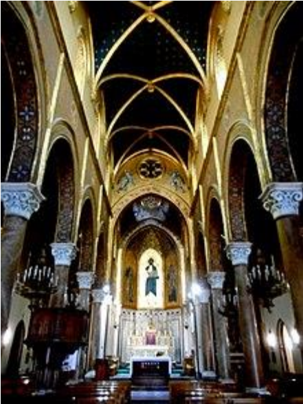
Chiesa San Pietro e Paolo

Perciò «GENTILEZZA» significa «NOBILTA' D'ANIMO» ricordando gli antichi Romani