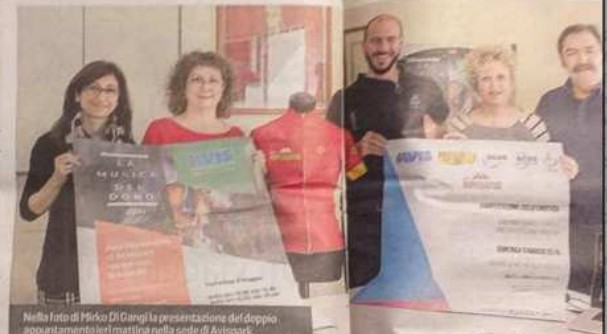
Nella foto di PIÙ DI GIANGI la presentazione del doppio appuntamento di Mantova nella sede di Avispark

Una giornata dedicata ai giovani, alla cultura del dono e allo sport. Domenica 5 maggio piazza Sordello si anima grazie agli eventi organizzati da Avis provinciale, scuole ed indirizzi musicali della provincia e Winton Sport. Dalle 10 alle 12.30 e dalle 15 alle 20 spazio a giovani orchestre e gruppi musicali composti da ragazzi per la musica del dono. Si esibiranno gli studenti degli istituti comprensivi di Asola (Schiavarello), Borgo Virgilio (Leopoldo di Borgoforte), Del Po (Goziglio), Gonzaga (Benvenuto Croce) e Mantova (Alberti e Mamei). Con loro i ragazzi del Conservatorio Campiani e del Liceo musicale Isabella d'Este. Alle 17 in programma i salotti istituzionali. Tra la tarda mattinata e il primo pomeriggio giungeranno in piazza anche i ciclisti impegnati nella Rando Imperator, gara su due ruote che unisce Monaco di Baviera a Ferrara. I partecipanti raggiungeranno la nostra città percorrendo la ciclabile che parte da Peschiera. Il loro viaggio proseguirà poi per Ceresole, il Ponte di Pietole, Governolo per poi percorrere l'argine del Po. In piazza Sordello è previsto un checkpoint e punto ristoro, oltre all'arri-