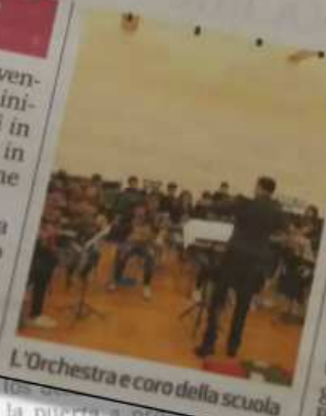
L'Orchestra e coro della scuola

L'Orchestra e coro della scuola media ad indirizzo musicale di Borgoforte (I.C. Borgo Virgilio) farà gli auguri di Natale a tutta la cittadinanza questa sera